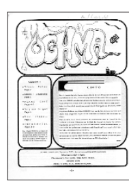
Oghma > N° 1