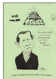
Le Gâteau sur la cerise > N° 15