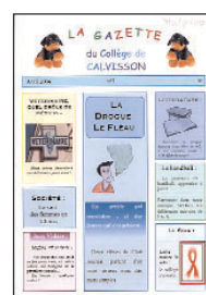
La Gazette > N° 1