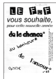
Le Fruit des Fendus > N° 25