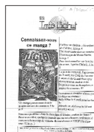
Info-Bahut > N° 4