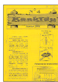
Keskidy > N° 4