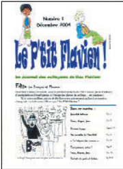
Le P'tit Flavien • n° 1