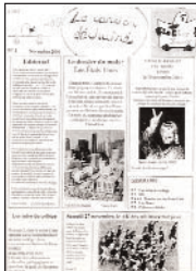
Le Caneton déchaîné • n° 1