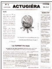
Actugiéra • n° 5