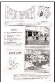
Le petit reporter •