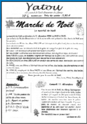
Yatou • n° 6

En 1994, avaient été faits des projets de paix entre les deux communautés, mais ils ont échoué car les deux états ont des points de vue différents : chacun croit que l'autre a tous les torts. Certains adultes des deux pays font croire aux enfants que les Israéliens ou les Palestiniens sont des « monstres », donc les enfants se haïssent entre eux, ce qui fait que les prochaines générations seront elles aussi des générations de soldats. Mona El Mslmy Intersections > n°30 - Avril 2005 Coll. Honoré de Balzac - Paris (75)