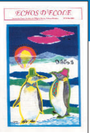
Échos d'école • n°11