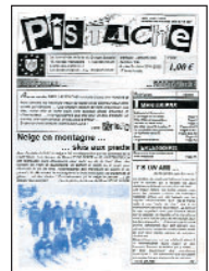
Pistache • n°154