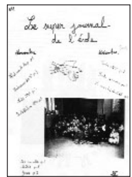
Le super journal • n°2