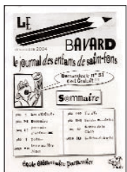
Le Bavard • n°51

Pas de presse sans rubrique sportive ! Des rédactrices témoignent de la place des jeunes filles dans les sports plutôt masculins.