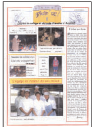
Stand'up • n°1