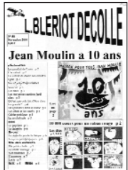
Le Blériot décolle • n°58