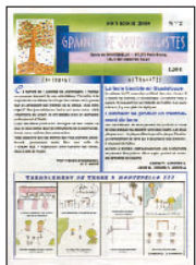
Graines de journalistes • n°2