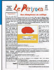
Le Périsien • n°23