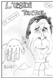
L'Obsédé textuel • Oct.04