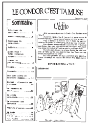
Le Condor c'est ta muse • Dec. 2004