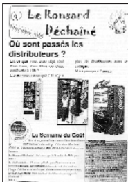
Le Ronsard Déchaîné • n° 1