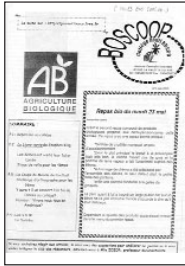
Boscoop • n° 3