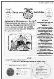
Pour une Planète Solidaire • n° 1