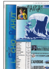
L'Écho du Bahut • n° 1