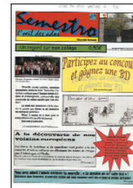
Semestre • n° 4