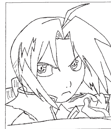
Dessin Coralline Mélanne

Les Infos à l'Appel > N° 5 – Mars 2006 Collège Appel du 18 Juin Blachon Lamentin (Guadeloupe)