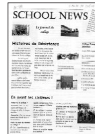
School News • n° 6