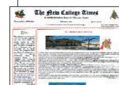
The New College Times • n° 2