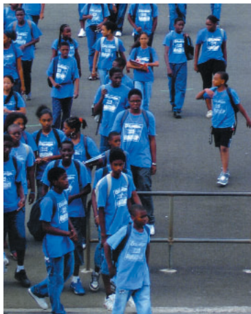
Extrait de la couverture

Collège Eugène Yssap – Valette (Guadeloupe)