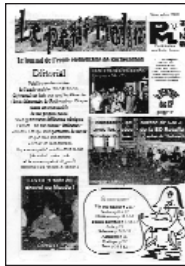
La Petit Malin • n°26