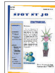
Spot St Jo • n° 3