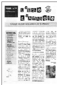
L'Écho d'Anatole • n°2