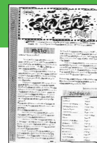
Aktubahu • n° 5

L'Écho des Ados > N° 14 Juin 2006 Coll. J. Michelet Creil (60)