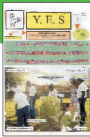
Y.E.S. • n°1

The New College Times > N° 5 – Juin 2006 Collège Romée de Villeneuve – Loubet (06)