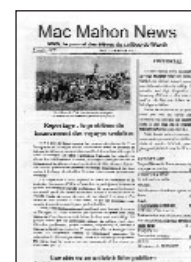
Mac Mahon News • n° 7