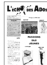
L'Écho des Ados • n° 14