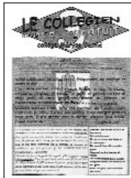
Le Collégien • n°spécial