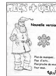
Meck + Ultra • n°4