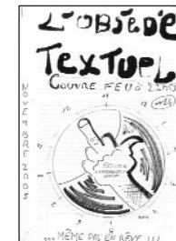
L'Obsédé Textuel • n°14