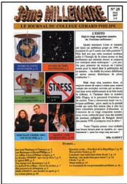
3 e Millénaire • n° 25