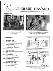
Le Grand Bavard • n° 34