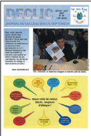
Décléc • n° 34