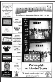
Infomaz • n° 13