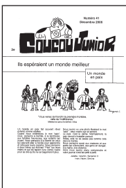
Coucou junior n° 41