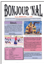
Bonjour'Nal n° 9

↑ Coucou Junior > N°41, DÉC. 2006, ÉCOLE JULES FERRY, RUEIL-MALMAISON (92)