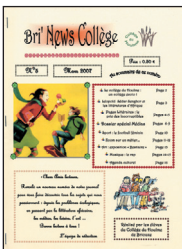
Bri'News Collège n° 5