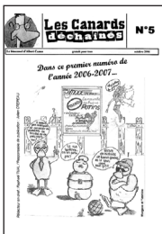
Les Canards Déchainés • n° 5

➔ Les Canards Déchainés > N° 5, OCT. 06, LYC. A. CAMUS, NANTES (44)