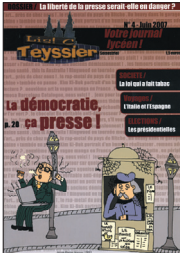
Lis! C Teyssier • n° 4