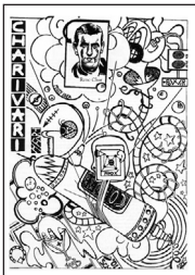
Charivari • n° 2