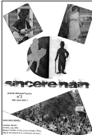
Le Sincère nain • n° 2