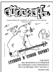
Autograph • n° 3