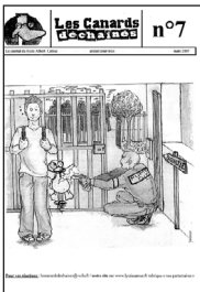
Les Canards Déchainés • n° 7